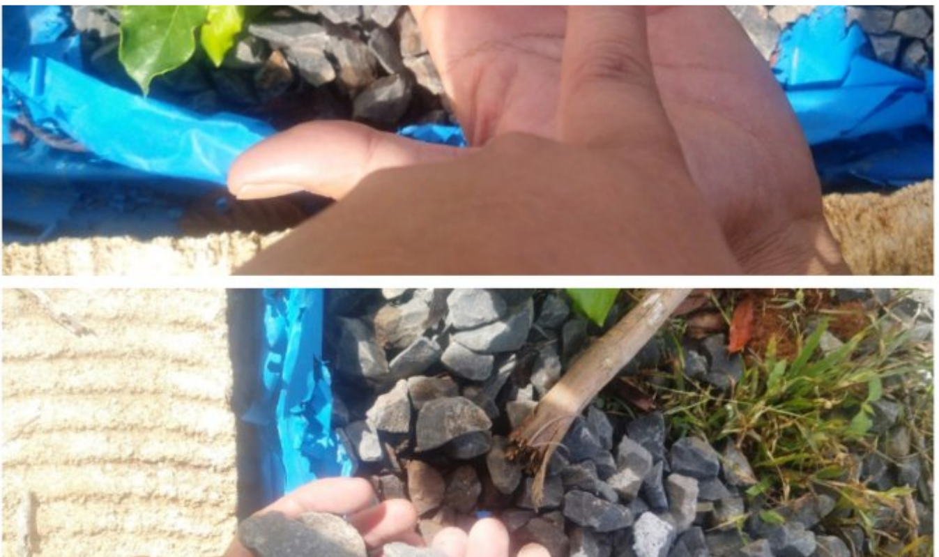
Rabat beton pekon batu kabayan

Lampung Barat - Pelaksanaan pembangunan jalan rabat beton dengan ukuran panjang 53,3 meter lebar 2 meter dan tebal 15 cm yang berlokasi di pekon batu kabayan kec. batu tulis kabupaten lampung barat yang bersumber dari dana desa tahun anggaran 2022 yang dilaksanakan oleh TPK pekon batu kabayan di duga bermasalah.